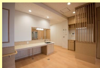
ユニットキッチン